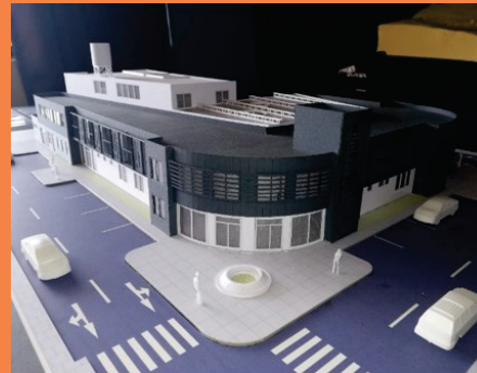
Centro de atención integral para la recuperación y desarrollo personal de la mujer víctima de violencia familiar en la ciudad de Tacna, 2017