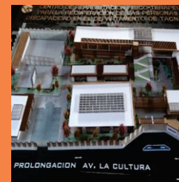
Centro de rehabilitación físico terapéutico para la recuperación de personas con discapacidad en el departamento de Tacna, 2018.