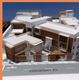
Centro de Refugio Temporal para Mujeres Afectadas por Violencia Familiar y/o Sexual para su atención Física y Psicológica en la Región de Tacna en el Año 2017.