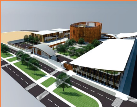
Propuesta del Centro de Exposición para Fomentar el Desarrollo Tecnológico de la Madera en Tacna 2017

Diseñar las estrategias para desarrollar este requerimiento que en este caso particular es inherente a la formación académica de la facultad de Arquitectura y Urbanismo, es un trabajo que consideramos pertinente describir, y socializar, pues resulta más sencillo trabajar sobre lo que ya hacemos y en todo caso mejorar y actualizar lo que vamos a hacer, y no inventar fórmulas que no conocemos.