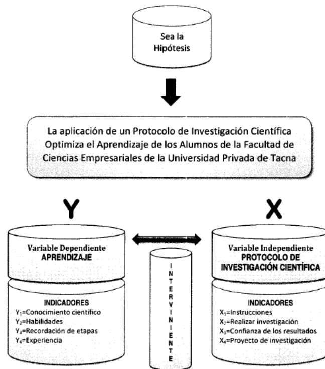
Figura 5. Representación gráfica de variables e indicadores

Operacionalizar una variable significa hacerla medible, es un proceso que va desde la definición de las variables, los indicadores hasta llegar a las preguntas que permitan recopilar la información específica. Este proceso engloba, tanto a la variable independiente como dependiente. A continuación, se operacionalizan las variables Aprendizaje y Protocolo de Investigación: